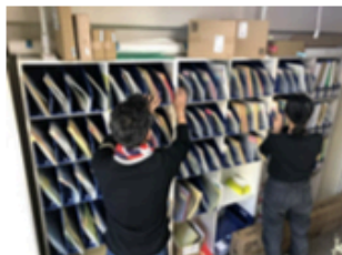
バーチャルオフィスに届いた郵便物は仕分けされ 指定住所に転送される

バーチャルオフィスの多くは、都心のビルの一角で会議室などを構えており、見た目はシェアオフィスと変わらないことが多い。ポイントはバーチャルオフィスの所在地を自分の会社の登記住所として利用できることだ。あくまでもサービスの根幹は住所を貸すことで、会議室などは希望者が必要に応じて追加料金を払って利用するオプションサービスの位置づけが多い。