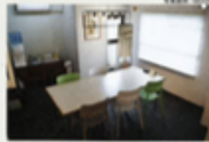
岸立地に建物を置けば水はくちや」というブリーチンヌに 人気のビーチハウスが完成